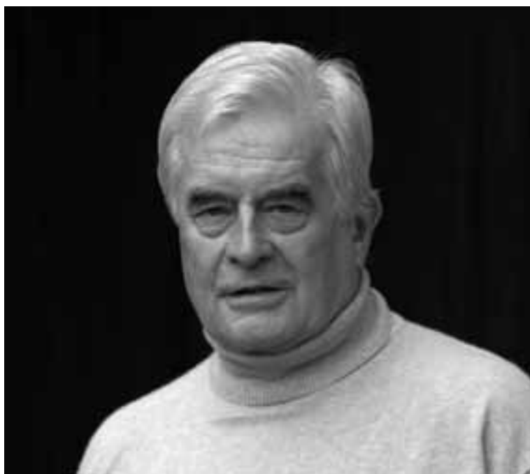
Botschafter des Ministeriums für Arbeit, Soziales und Konsumentenschutz im Europäischen Jahr 2010 zur Bekämpfung von Armut und Sozialer Ausgrenzung.

Dazwischen meldet sich immer wieder mein Magen. Sei es aus Hunger oder im Sommer die Kehle aus Durst. Das Bild, mir Drogen beschaffen zu müssen, weil ich abhängig bin, verbanne ich sofort wieder aus meiner Vorstellung. Der Zwang, unter dem ich dann zu leiden hätte, ist einfach zu schrecklich.