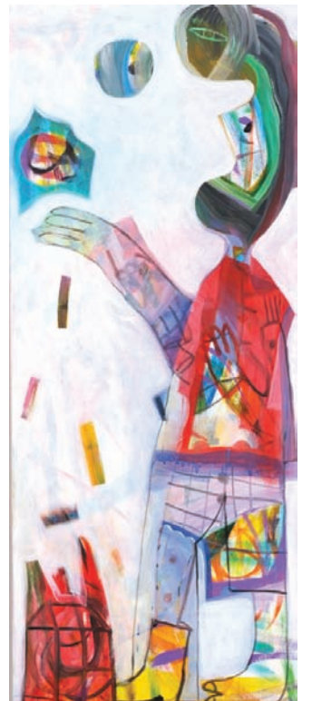
Anselm Glück: „Zustand (Zeitvergleich)“ aus dem Jahr 2010, Technik: Acryl auf Leinwand, Rufpreis: 2.000 €.

strasse 3) besichtigt werden. Eine Vorbesichtigung der Arbeiten findet auch im Kunstraum Wohlleb, Seidlgasse 23, 1030 Wien, vom Donnerstag, 14. 10., bis Mittwoch, 27.10. statt. ls