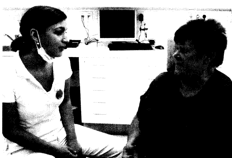
Obdachlose werden in der neunerHaus Zahnarztpraxis unabhängig von ihrem Versicherungsstatus behandelt.

Interessierte Zahnärzte, die mitarbeiten wollen, werden noch gesucht und mögen sich beim Verein neunerHAUS melden: Tel: 01/7135946-17.